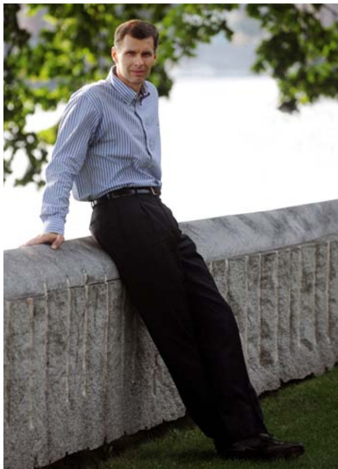
Kandidát na předsedu olympijského výboru Jiří Kejval