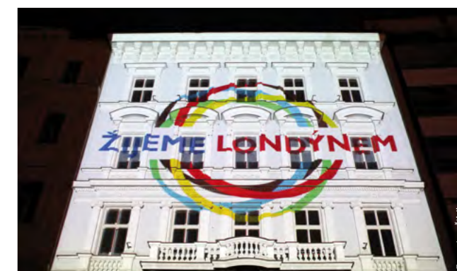
Ve vybraných městech se fanoušci mohou těšit na stále oblíbenější videomapping, tedy interaktivní promítání na fasády domů.