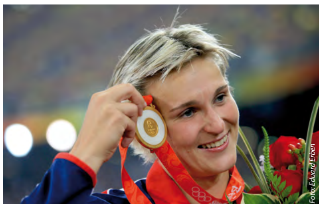
Olympijská vítězka Barbora Špotáková v Pekingu, ilustrační foto.

Český olympijský výbor poskytne navíc za každé získané účastnické místo v Londýně 100 tisíc korun na přípravu sportovců. O přidělení podpory rozhodl na svém červnovém zasedání Výkonný výbor ČOV.