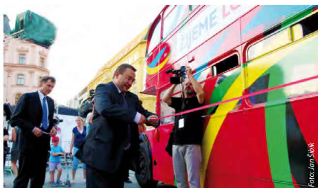
Olympijský doubledecker pokřtil v Brně ministr školství, mládeže a tělovýchovy Josef Dobeš.