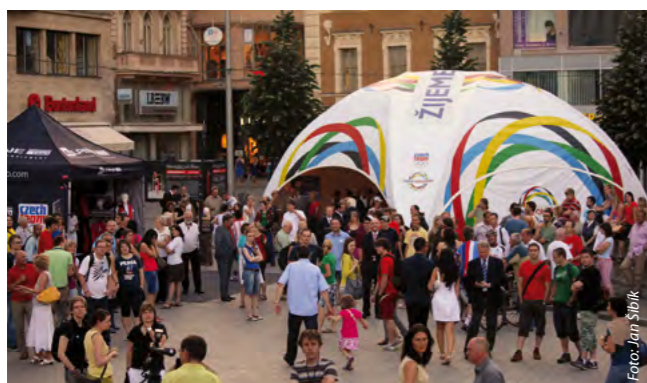
Slavnostní zahájení kampaně proběhlo v Brně 24. května 2011, podívat se přišly stovky fanoušků.