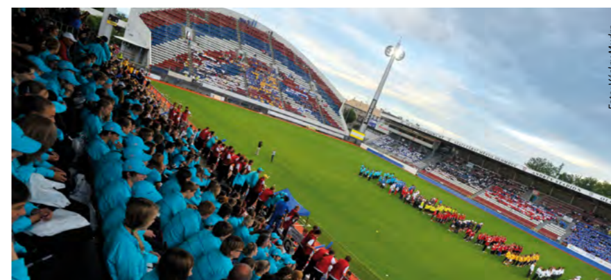
Slavnostní zahájení na Andrově stadionu v Olomouci