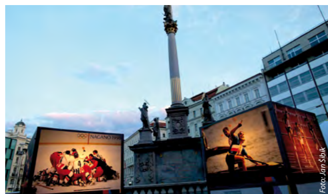
Podsvícené fotografie sálají atmosférou, zde na náměstí Svobody v Brně.