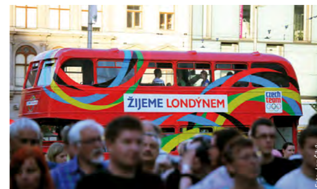
Doubledecker je vyvedený v olympijských barvách, ale zároveň si zachovává symbolický anglický vzhled.