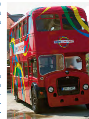
Symbol kampaně: Originální anglický doubledecker těsně před tím, než vyrazil z Prahy na svou pouť po České republice.

Skvělá atmosféra provázela kampaň i při jejích dalších zastávkách, projekt byl oficiálně představen ještě v Jihočeském, Ústeckém, Olomouckém a Královéhradeckém kraji. Po prázdninách vyjíždí Žijeme Londýnem opět mezi fanoušky.