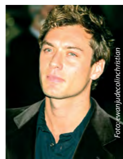
Herec Jude Law

V úterý 21. června to byl přesně rok do zahájení finále kulturní olympiády (ta začala už roce 2008), neboli Festivalu 2012. Jedná se o dvanáct týdnů nejrůznějších akcí. Podrobné informace o akci jsou k dispozici na webových stránkách www.london2012.com/festival . Kultura je jedním ze tří pilířů her 2012, společně se sportem a vzděláváním. Na projektu se podílejí i světoznámý herec Jude Law či zpěvák Damon Albarn z Gorillaz.