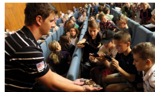
Vzdělávací program pro školáky navštívuje v každém městě vždy několik set dětí. Prohlédnout si mohou artefakty sportovců, například olympijské medaile Kateřiny Neumannové.