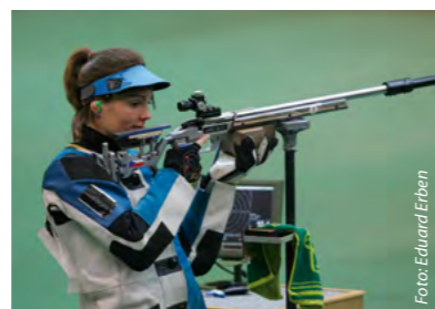
Kateřina Emmons již účastnické místo pro Hry XXX. olympiády v Londýně 2012 vystřílela.

Český olympijský výbor hospodařil v roce 2010 s výdaji 111,44 milionu korun a příjmy ve výši 115,32 milionu korun. Původní rozpočet počítal se schodkem. Realita je vyrovnané hospodaření s vytvořením rezervy pro rok 2011.