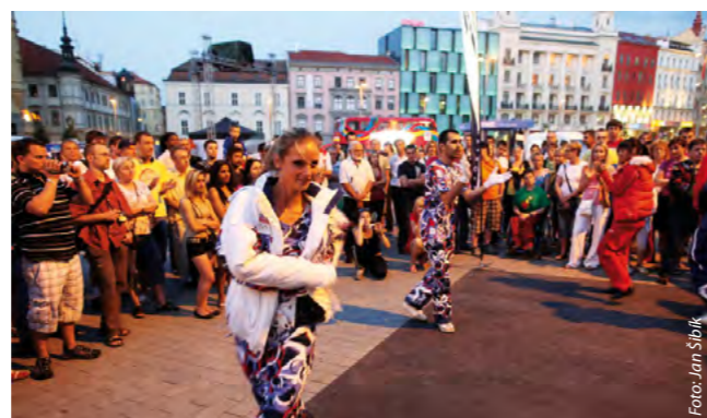
Součástí vemisází velkoformátových fotografií je i módní přehlídka olympijského oblečení Alpine Pro.