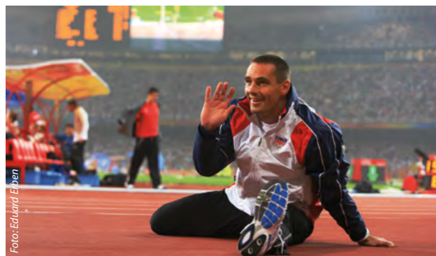
Desetibojař Roman Šebrle se představil v 18. dílu pořadu.

Velké sportovní výkony, české olympijské hvězdy, cesta do Londýna 2012, ale také pohled do světa fanoušků. Nejen to nabízí Olympijský magazín, společný projekt České televize a Českého olympijského výboru.