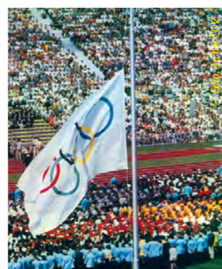
Ilustrační foto z LOH 1972

Mnichov, který kandiduje na uspořádání ZOH v roce 2018, se představil na konferenci SportAccord. Své akcie staví zejména na odkazu mnichovských her 1972. „Mnichov se může stát prvním městem v dějinách, které promění sportoviště letních olympijských her na sportoviště her zimních. Tím může toto dědictví prodloužit ze současných čtyřiceti na osmdesát let,“ zdůraznil starosta Mnichova Christian Ude.