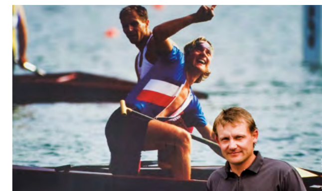
Do Ústí nad Labem pak přijel rychlostní kanoista Martin Doktor, dvojnásobný olympijský vítěz.